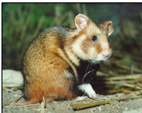
Abb. 4: Der Feldhamster ist mit 20 -25 cm Körperlänge etwa so groß wie ein Meerschweinchen