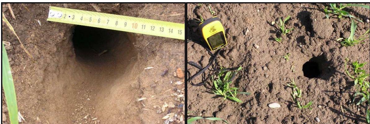
Abb. 3: Schräge Schlupfröhre (links) und senkrechte Fallröhre (rechts) eines Hamsterbaus