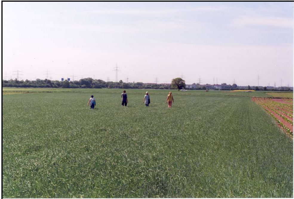
Abb. 2: Hamsterbausuche in einem Getreidefeld im Frühjahr.

Gearbeitet wird dabei in Teams von vier bis sechs Personen, die mit einem Lauflinienabstand von 2-3 m in Reihe über die Felder gehen (Abb. 2). Die Koordinaten jedes Hamsterbaus werden mit einem GPS-Gerät aufgenommen und die Charakteristika des Baus (Anzahl Röhren, Typ, Alter etc.) sowie die Feldfrucht und Flurstücksnummer des Ackers in einen Erfassungsbogen von Hand eingetragen (Abb. 3).